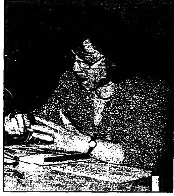
رشيحة التركي (القدس العربي)